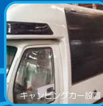
キャンピングカー設置