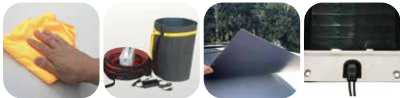
① 設置面の清掃 ② パネル準備 ③ パネル取付 ④ 落下防止 (ハトメ使用)