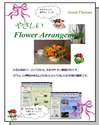
楽しみながら生活を彩る教養ソフト。 やさしい Flower Arrangement